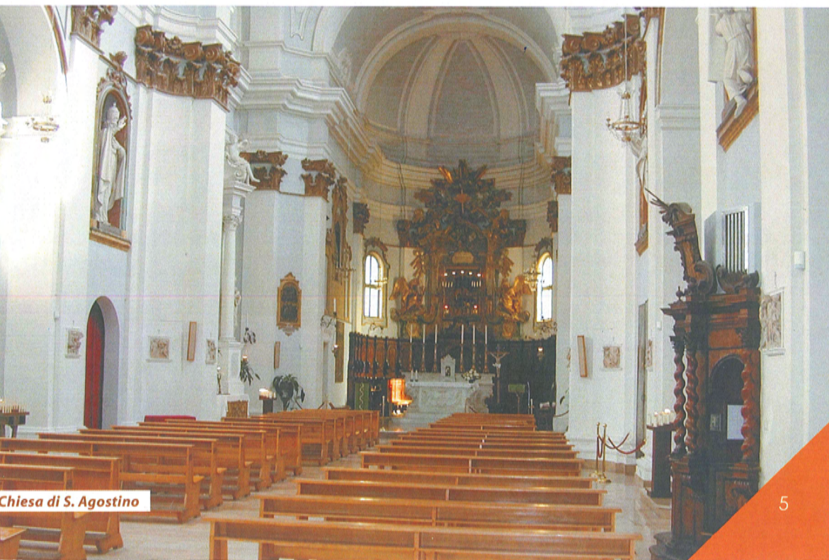
Chiesa di S. Agostino

Ore 19.00 > S. Messa per i Benefattori del Santuario.